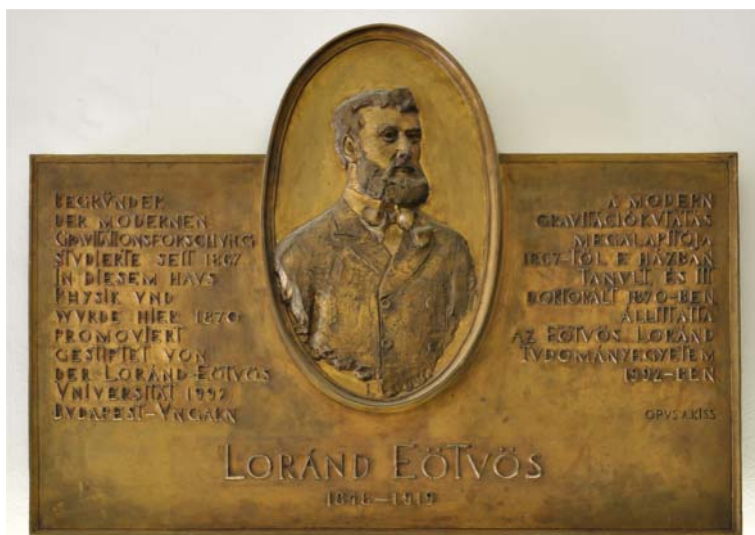
Eötvös Loránd emléktáblája a Heidelbergi Egyetem falán.

nyai sorába. Az 1868/69-es tanévet tehát már fizikus hallgatóként kezdte el, majd a második félévet Kirchhoff tanácsára az ő kedvenc tanárainál folytatta Königsbergben.