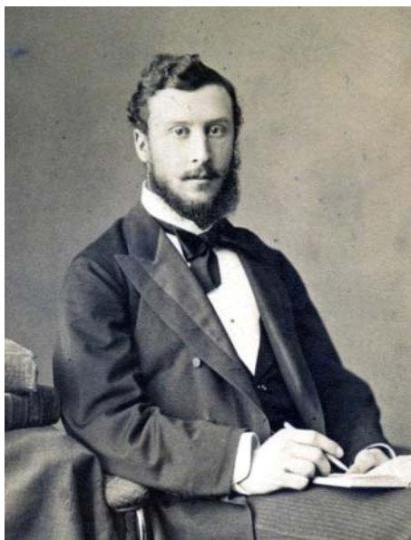
A 27 éves Eötvös Loránd.

1875: májusi eljegyzést követően júliusban, két nappal Loránd 27. születésnapja után tartották meg az esküvőt, még pedig Marienbadban (ma Mariánske Lázně a cseh–német határ közelében), de itthonról vitt katolikus pap adta össze őket, hazai szertartás szerint. Utána Franciaországba utaztak nászútra. Hazánkban az év egyik legfontosabb eseménye a Zeneakadémia megalakulása volt, Liszt Ferenc indítványára. A fiatal pár első lakása a Kecskeméti utcában volt, innen járt Eötvös Loránd a Papnövelde utcában lévő egyetemi épület második emeletén lévő tanterembe előadást tartani a leendő orvosok, gyógyszerészek és tanárok számára. Ez év őszén már Általános Kísérleti Természettan címmel hirdette meg kísérleti fizika előadását az első évesek számára. A hét mind az öt nap-